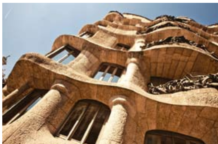
▲ LA PEDRERA Museu Nacional d'Art de Catalunya