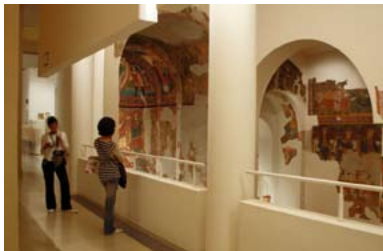
▲ WNETRZE MNAK

CaixaForum: to jedno z najbardziej prestiżowych centrów kultury w Hiszpanii z bogatą ofertą wystaw czasowych, konferencji i zajęć edukacyjnych dla całych rodzin.