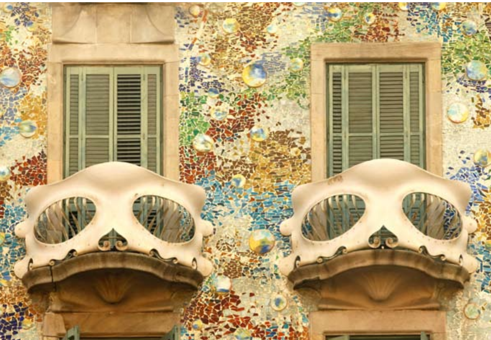
▼ DOM CASA BATLLÓ

Barcelona jednoznacznie kojarzy się z Antoniem Gaudím. Na tym szlaku poznasz jego najbardziej reprezentacyjne dzieła, a wśród nich Sagrada Familia – niekwestionowany symbol miasta. Pierwsze, co przyciąga wzrok, gdy patrzymy na tę świątynię, to strzeliste wieże. Na niektóre z nich można się dostać, by z wysokości podziwiać miasto. W centrum Eixample, na Passeig de Gràcia, zachwyci cię swoją falistą strukturą dom Casa Milà , znany też jako La Pedrera, a Casa Batlló z kolei – oryginalną, kolorową fasadą. Pospaceruj też po Parku Güell , co pozwoli ci lepiej zrozumieć ścisły związek przyrody z architekturą Gaudiego.