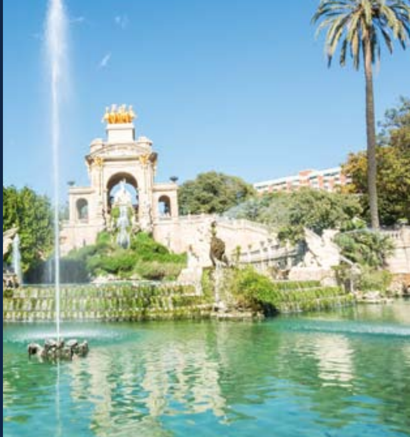
▲ PARC DE LA CIUTADELLA

Barcelona to miasto pełne życia, skarbów i tajemnic. Urokliwe parki, muzea, niezwykle punkty widokowe. Jeśli masz trochę więcej czasu, polecamy ci następujące miejsca: