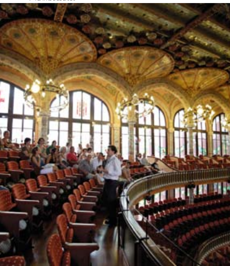
▼ TEATRE DEL LICEU