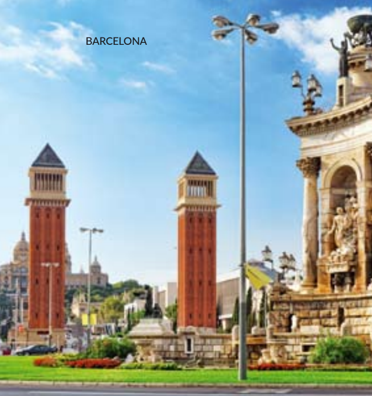
▲ PLAC HISZPAŃSKI