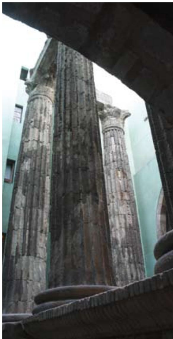
▲ ŚWIĄTYNIA AUGUSTA

Pozostałości po Barcelonie z czasów średniowiecza najbardziej widoczne są w dzielnicy Ciutat Vella . Jedno z ciekawszych miejsc to Plaza del Rei z Pałacem Porucznika (Palau del Lloctinent) oraz imponującym pałacem królewskim Palau Reial Major . Po drodze zajrzyj do okolicznych kościołów, spośród których wyróżnia się gotycka bazylika Santa Maria del Pi (Matki Boskiej Sosnowej), bazylika Santa Maria del Mar (Matki Boskiej Morza) oraz klasztor San Pere de les Puelles (św. Piotra od Dziewic).