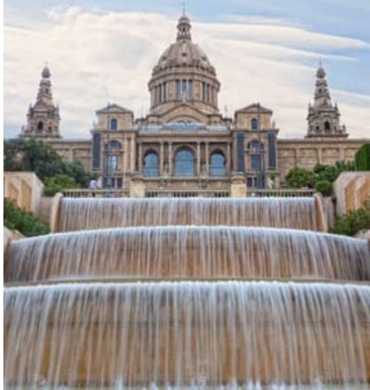
▲ PALAU NACIONAL