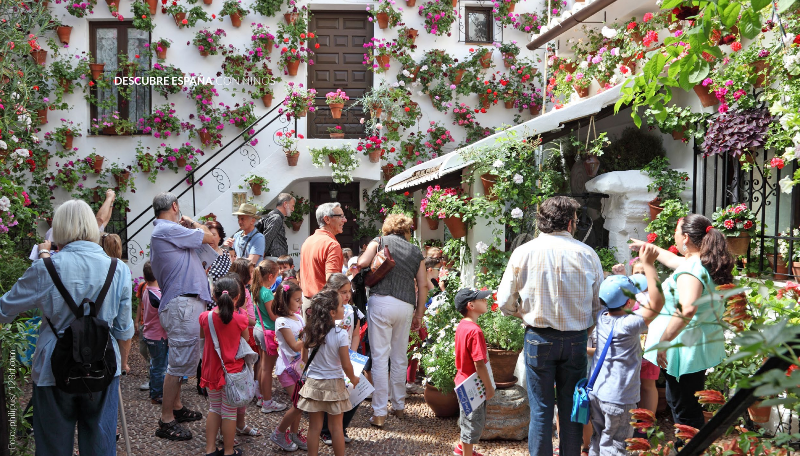
▲ PATIO CORDOBÉS CÓRDOBA