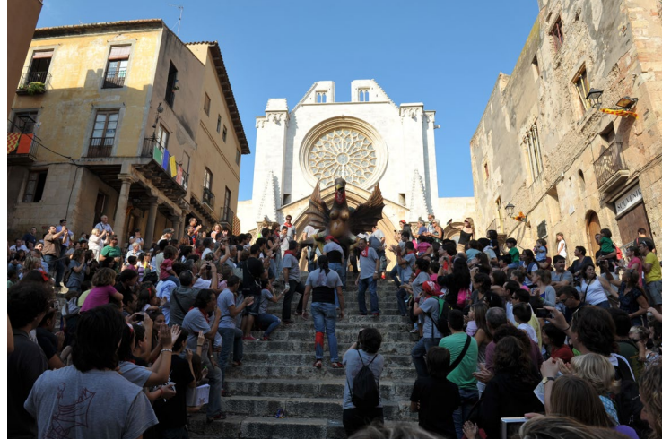
▲ CATEDRAL DE SANTA TECLA TARRAGONA