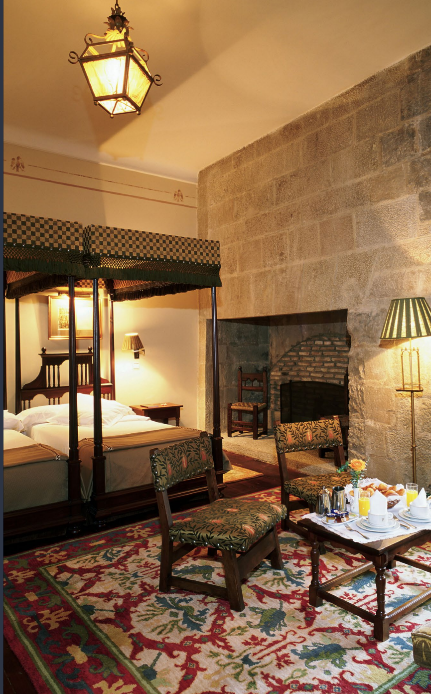
▲ PARADOR DE OLITE NAVARRA

Las casas rurales son una opción estupenda para disfrutar de la naturaleza en familia. Se trata de antiguas construcciones (casas de labranza, masías, cortijos, caseríos o molinos) que han sido rehabilitadas como alojamientos turísticos con todas las comodidades. Allí dormiréis rodeados de parajes de ensueño y disfrutaréis de una gastronomía de primera. Muchas están equipadas con parques infantiles y ofrecen multitud de propuestas al aire libre para todas las edades, como paseos y rutas a pie, en bicicleta o a caballo. Habitualmente se encuentran en pequeñas localidades o fuera del casco urbano en ciudades de mayor tamaño.