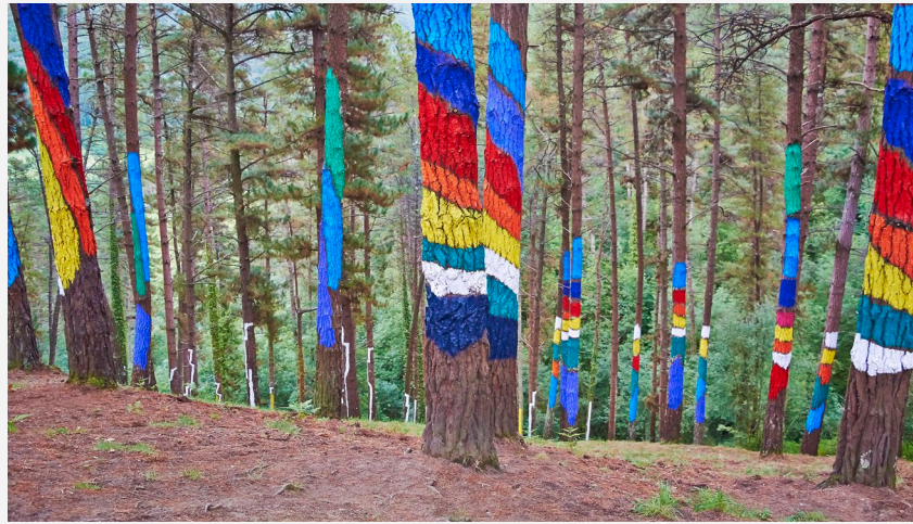
▲ BOSQUE PINTADO DE OMA VIZCAYA

Conoce el norte de España adentrándose en parajes naturales de excepcional belleza emprendiendo el Camino de Santiago. El final del Camino Francés, el más popular, es el que se inicia desde Sarria, ya en Galicia . Dividida en seis o siete etapas, es la ruta más indicada para familias con niños a partir de 10 años. Conviene reservar