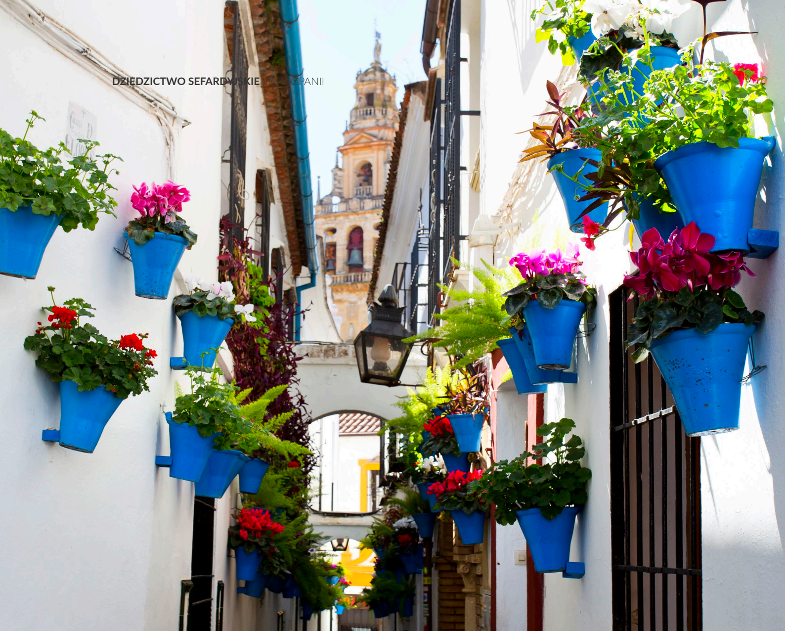
▲ ZAULĘK CALLEJA DE LAS FLORES KORDOBA