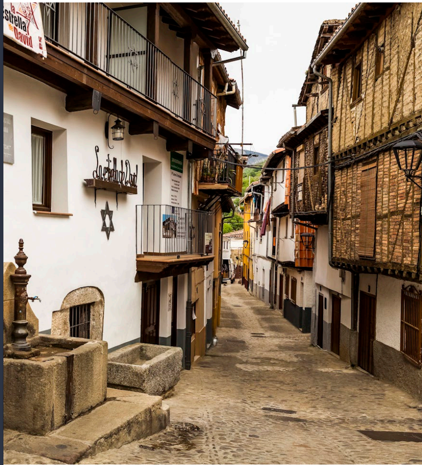
▲ HERVÁS CÁCERES

Dzień zakończ wizytą na cmentarzu żydowskim Berrocal przekształconym w otwarte dla zwiedzających muzeum podkreślającym wagę tego historycznego miejsca.