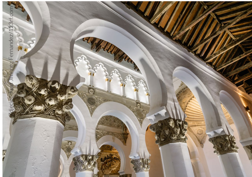
▲ SYNAGOGA SANTA MARÍA LA BLANCA TOLEDO

Na północnym patio Muzeum Sefardyjskiego znajduje się stała instalacja Ogrodu Fonicznego , która odtwarza odgłosy życia uliczek dawnej żydowskiej dzielnicy Toledo. Gwar i rozmowy w ladino (języku hiszpańskich Żydów) z sefardyjską melodią w tle sprawią, że poczujesz się jak na spacerze po średniowiecznej żydowskiej dzielnicy Toledo.