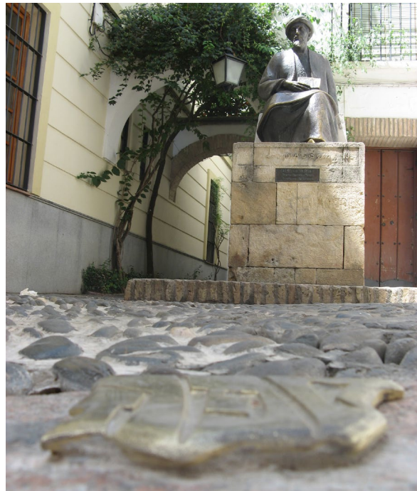
▲ DOM SEFARADU KORDOBA

Odwiedź Miejski Suk Rękodziela (Zoco Municipal de Artesanía), targ, gdzie rzemieślnicy z Kordoby wytwarzają i oferują swoje wyroby ze srebra, ceramiki lub skóry. W maju, podczas popularnego Festiwalu Kordobańskich Patiów, wpisanego na listę niematerialnego dziedzictwa