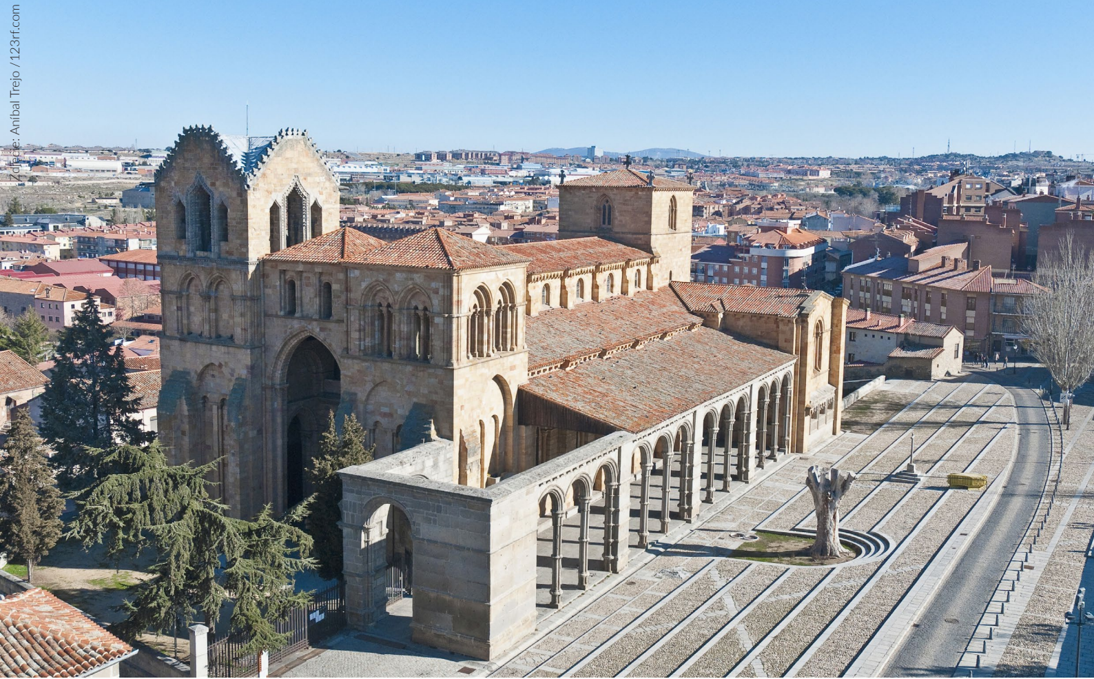
▲ BAZYLIKA SAN VICENTE ÁVILA

W bramie miejskiej San Andrés znajduje się punkt informacji turystycznej La Murralla. Można podziwiać stąd niezrównane widoki na okolicę i żydowską nekropolię z zachowanymi pozostałościami miejsc pochówku o wyjątkowej wartości archeologicznej.