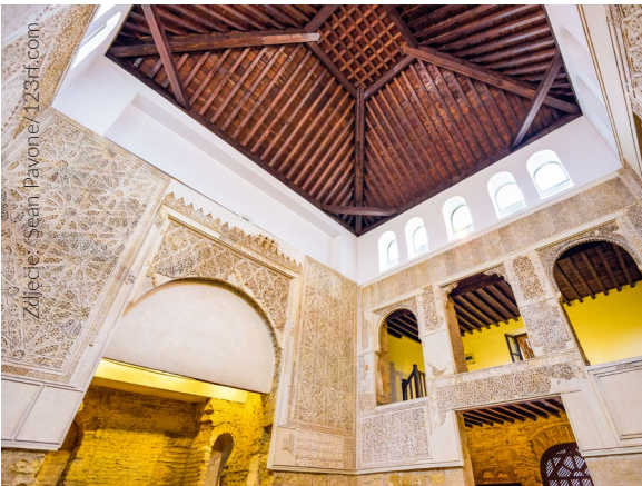
▲ SYNAGOGA KORDOBA

Synagoga w Kordobie jest unikatową i jedną z najlepiej zachowanych w Hiszpanii. Zbudowana w pierwszej ćwierci XIV w. pełniła funkcję religijną do 1492 r. Dzięki pracom konserwatorskim i restauratorskim zarówno liczba, jak i stan zachowanych inskrypcji są imponujące.