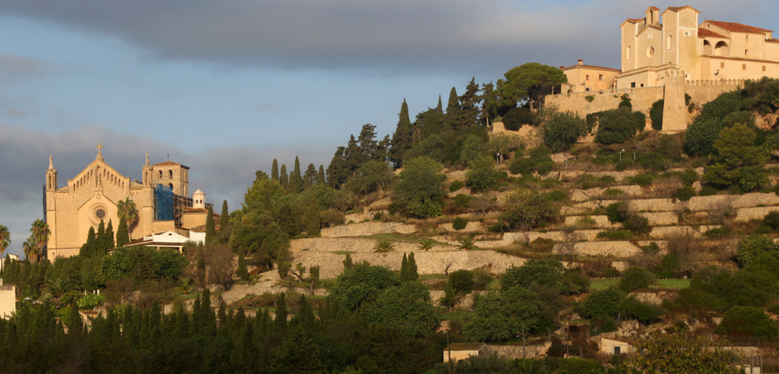
▲ ARTÁ MAJORQUE

Sóller , puis prenez le tramway en bois qui assure la correspondance. Si vous préférez la randonnée, suivez la Ruta de Piedra en Seco. À l'extrême nord, laissez-vous captiver par la vue offerte depuis les belvédères et les criques du cap Formentor , à quelques kilomètres du port de Pollença. L'une des plus belles excursions à programmer pendant votre séjour à Majorque reste celle du monument naturel du Torrent de Pareis , une spectaculaire falaise. Cette gorge impressionnante de 3 kilomètres débouche sur la plage pittoresque de Sa Calobra . À découvrir à pied ou en bateau depuis le port de Sóller .