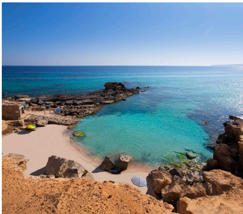
▲ CALÒ D'ES MORT FORMENTERA

L'option idéale pour pratiquer le nudisme. La plage compte 300 mètres de large, au pied d'une falaise. Vous pouvez profiter de votre visite pour prendre un bain de boue, comme dans un spa.