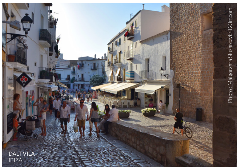
DALT VILA IBIZA