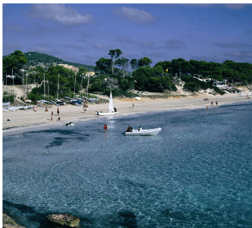
▲ PARC NATUREL DE SES SALINES IBIZA

Admirez depuis la plage le profil des îlots d'Es Vedrà et Es Vedranell, dans le parc naturel Cala d'Hort, Cap Llentrisca y Sa Talaia . Le site est idéal pour la plongée sous-marine, la randonnée et le cyclisme.