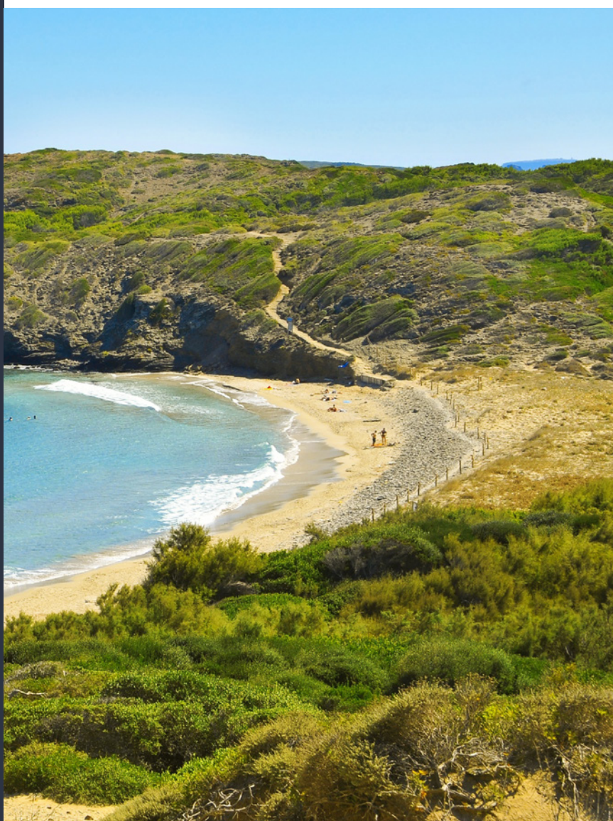
▼ CALA TORTUGA MINORQUE

Au nord, le sable rougeoyant contraste avec une mer aux tons bleus et verts. Certaines plages sont entourées de dunes, comme celle de Binimel-là , dans la réserve marine du nord, ou de falaises, comme Cala Morrell , où s'allonger sur ses plateformes de roche artificielle.