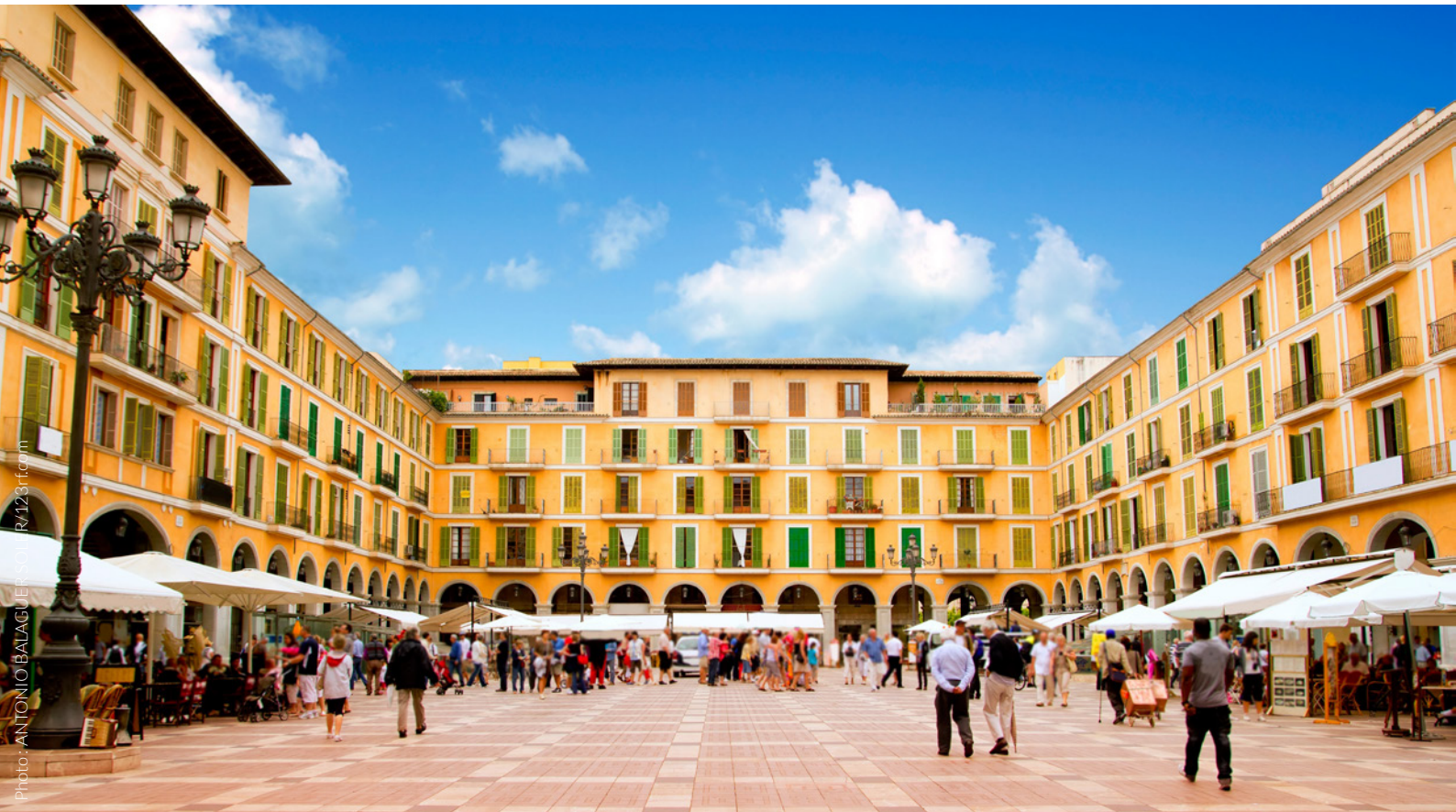
▲ PLAZA MAYOR, PALMA MAJORQUE

Nature, sport, plages, villages de charme, grottes souterraines, offre de loisirs des plus divertissantes pour les familles... Majorque a tout pour plaire. Qu'attendez-vous pour la découvrir ?