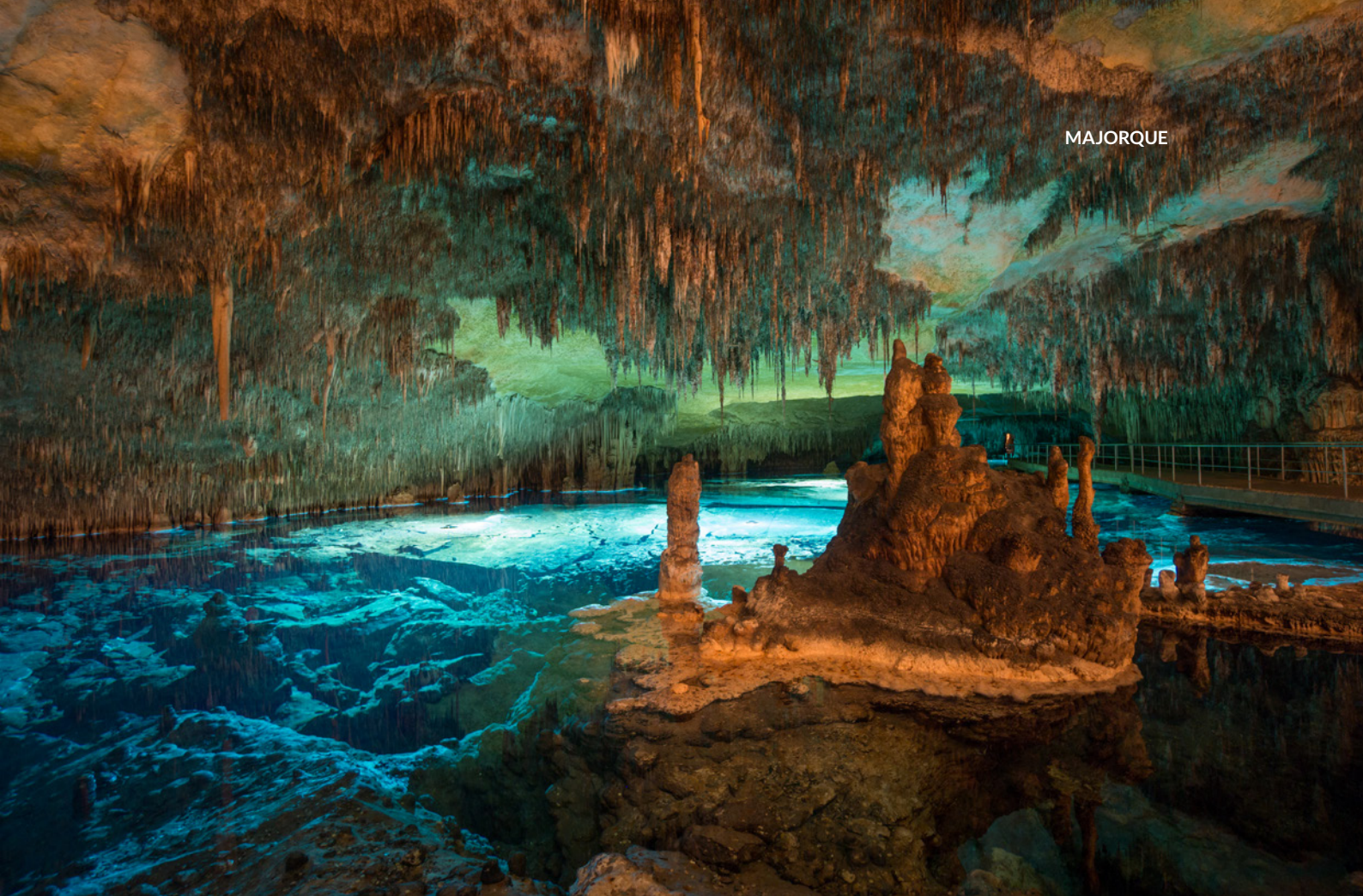
▲ GROTTES DU DRACH, PORTO CRISTO MAJORQUE