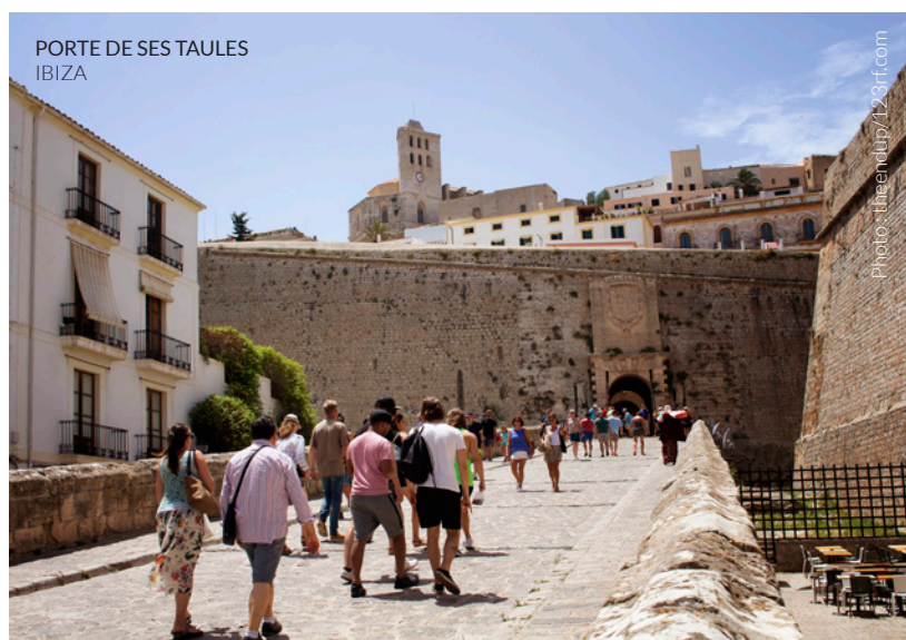
PORTE DE SES TAULES IBIZA

Adoptez le tourisme créatif, une nouvelle tendance qui conquiert différentes villes du monde : participez à des activités stimulantes, notamment des ateliers de musique, de danse, de photographie, de langues ou de cuisine.