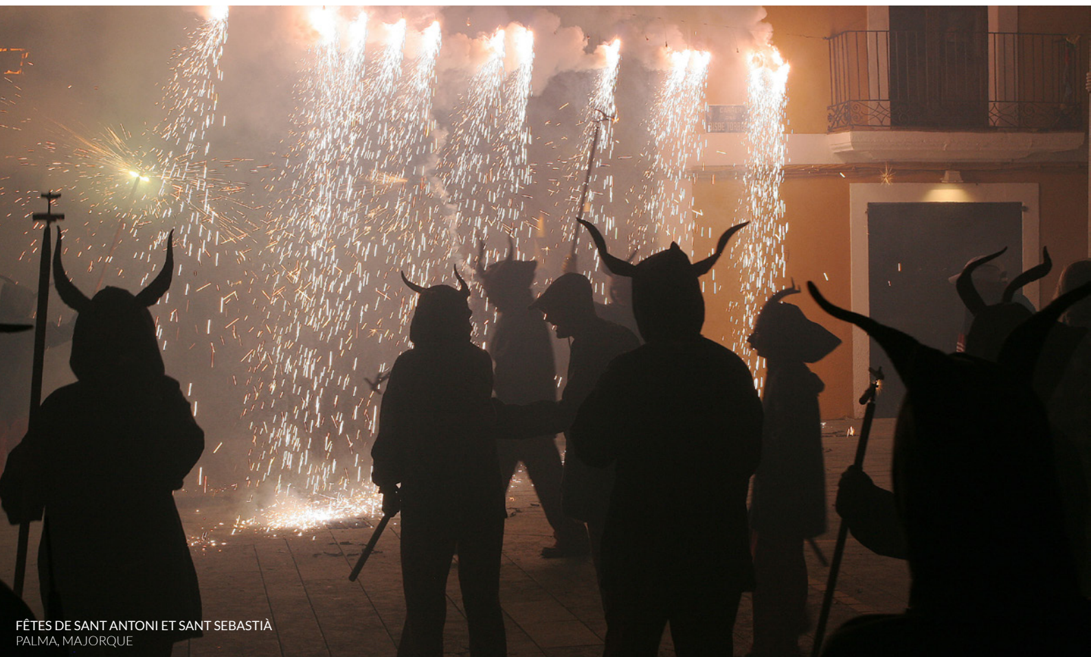
FÊTES DE SANT ANTONI ET SANT SEBASTIÀ PALMA, MAJORQUE