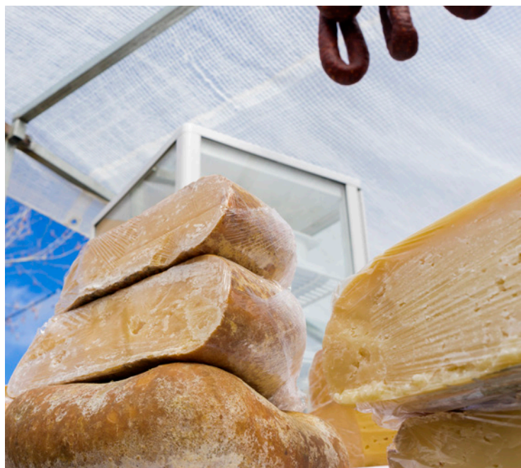
▲ FROMAGE DE MAHÓN MINORQUE

Au marché artisanal de Ciutadella , parmi les plus prisés en été, vous trouverez absolument tout : des bijoux aux chaussures, en passant par des créations en céramique et des illustrations.