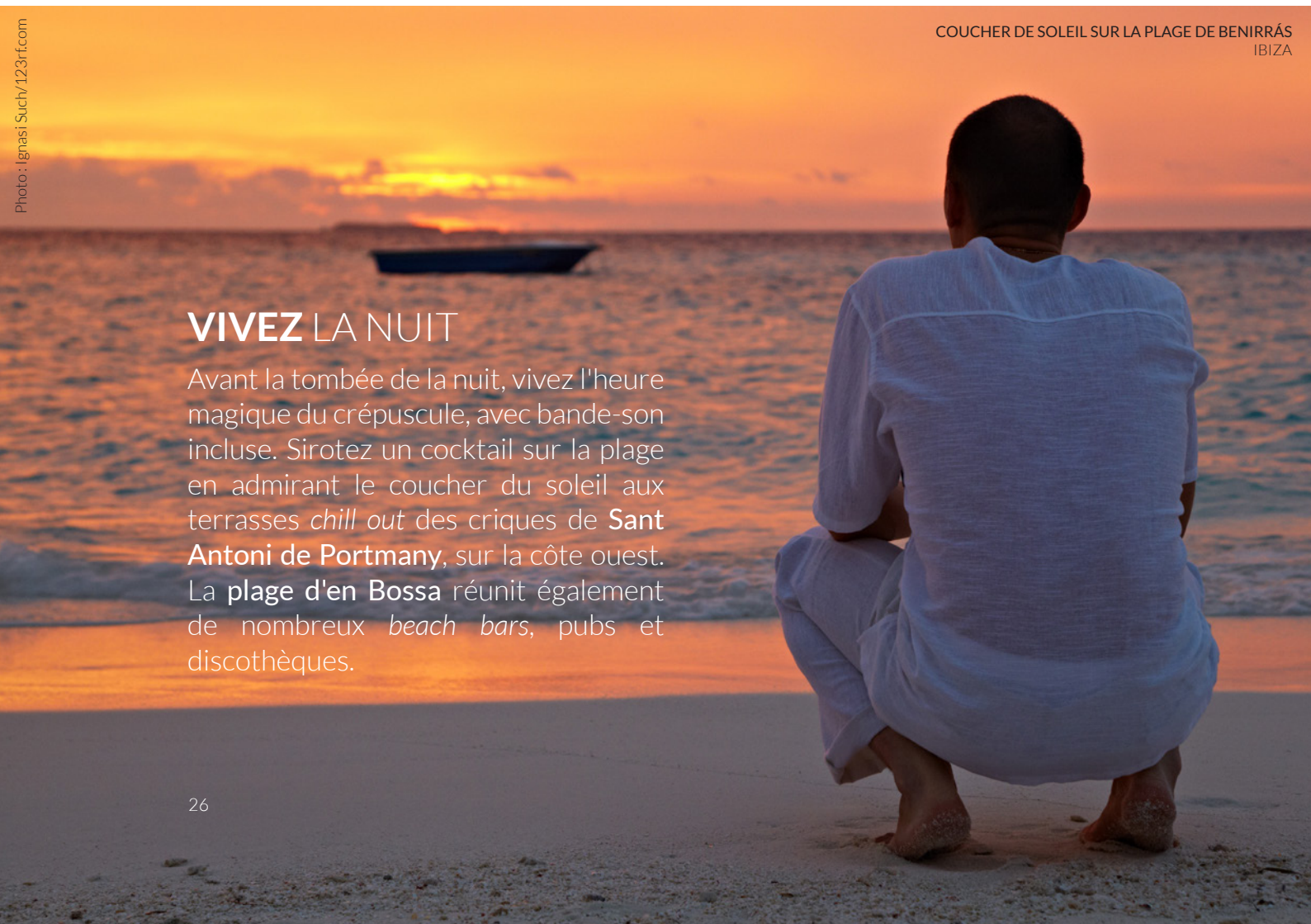
COUCHER DE SOLEIL SUR LA PLAGE DE BENIRRÁS IBIZA