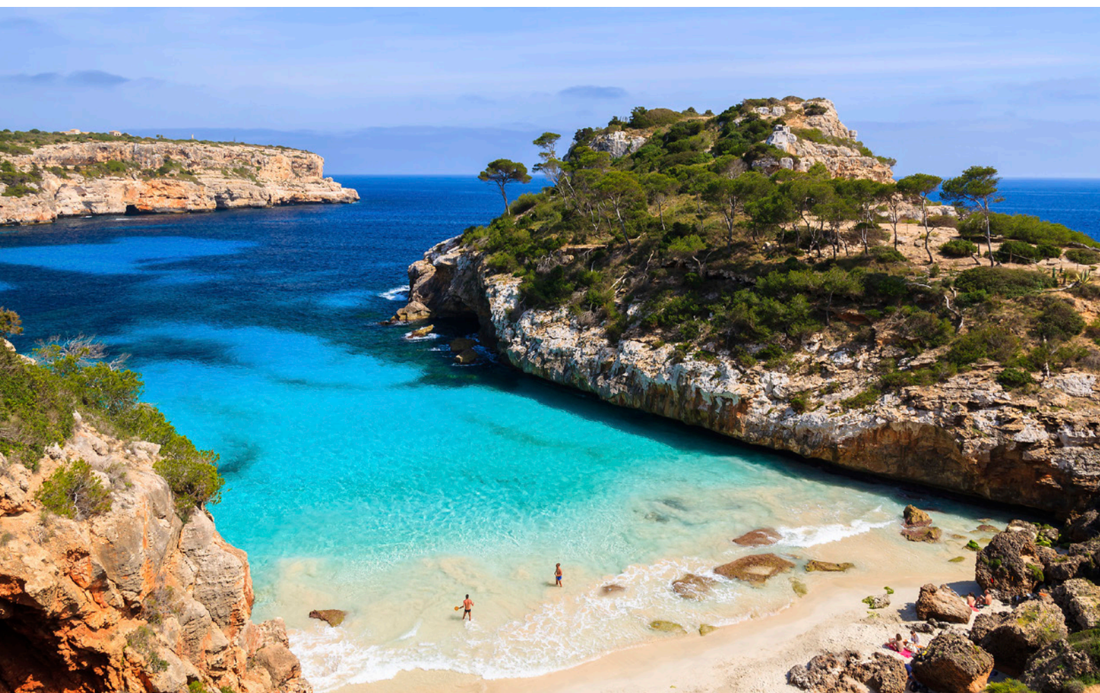
▲ CALÒ DES MORO MAJORQUE

Falaises spectaculaires, immenses plages vierges, criques de charme... Choisissez votre plage préférée des îles Baléares et profitez de vacances de rêve dans une eau cristalline. Voici une petite sélection de 10 recoins idylliques.