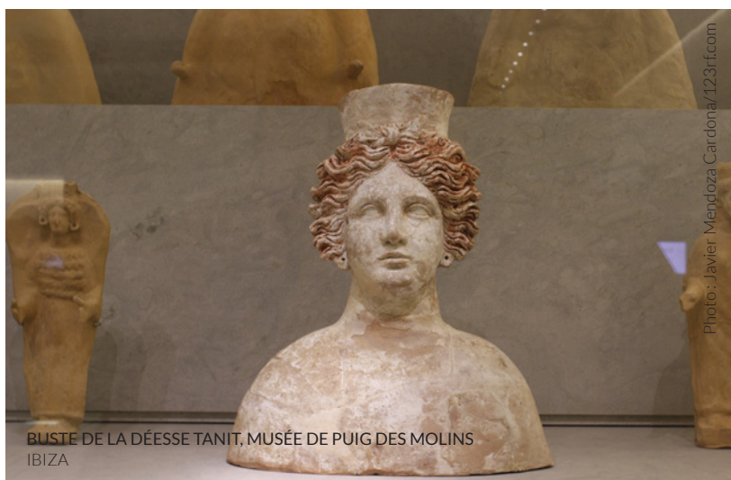
BUSTE DE LA DÉESSE TANIT, MUSÉE DE PUIG DES MOLINS IBIZA