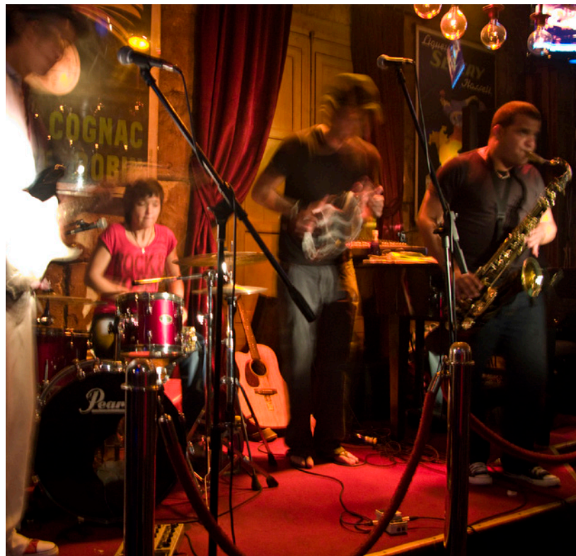
▲ FESTIVAL JAZZ OBERT MINORQUE

Quant aux sportifs, ils bénéficient d'une programmation complète à cette saison, avec par exemple Formentera to run , une course de soixante kilomètres à travers les plus beaux recoins de l'île (fin mai ou début juin). Vous pouvez aussi participer à la traversée à la nage Formentera-Ibiza Ultraswim , une course de 30 km entre les deux îles, combinée avec deux autres épreuves de 5 km et 750 m, généralement au mois de mai.