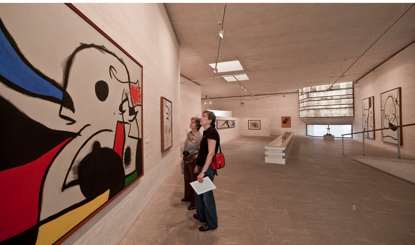
▼ FONDATION PILAR ET JOAN MIRÓ MAJORQUE

Pour finir, remontez jusqu'à la préhistoire en visitant les ensembles talayotiques , les villages des premiers habitants de l'archipel. La localité d'Artà possède l'un des plus grands et des mieux conservés : Ses Païsses , installé dans une jolie forêt de chênes.