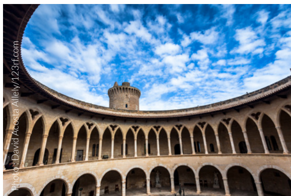
▲ CHÂTEAU DE BELLVER, PALMA MAJORQUE

Et pour contempler l'île depuis une perspective privilégiée, à 3 kilomètres environ du centre historique, se situe le château de Bellver , de facture gothique, l'un des rares en Europe construits selon un plan circulaire.