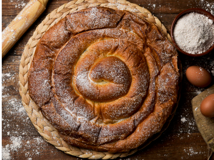
▲ ENSAIMADA MAJORQUE

Le cuir mérite également une mention spéciale, notamment les chaussures, célèbres dans le monde entier pour leur qualité. Pour découvrir leur processus de création artisanale, rendez-vous dans certains des sites de confection, par exemple à Inca, dans la région du Raiguer, au centre de l'île. Vous pourrez y visiter des fabriques.