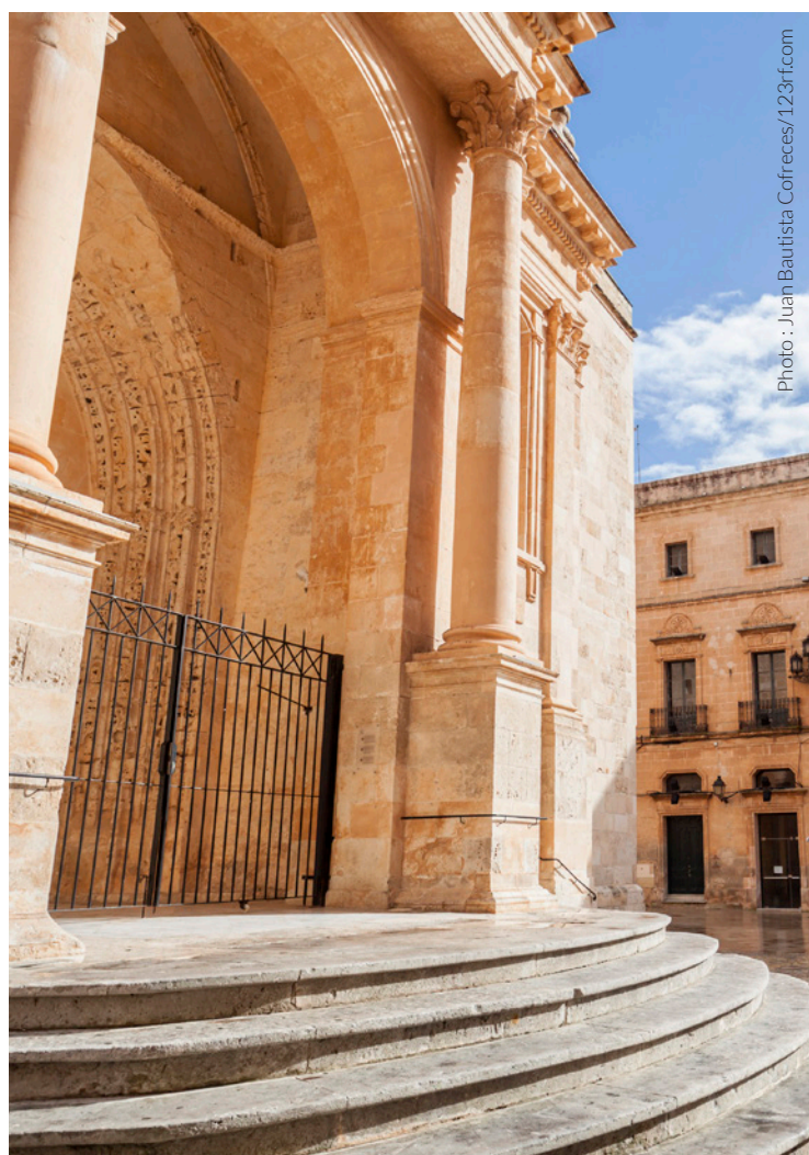
▲ CATHÉDRALE SANTA MARÍA CIUTADELLA, MINORQUE

Les environs possèdent des monuments mégalithiques qui témoignent des origines préhistoriques de l'île. Visitez la Naveta des Tudons , une tombe collective de l'âge du bronze, parmi les constructions les plus anciennes d'Europe.