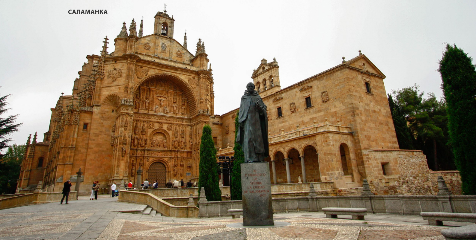
▲ МОНАСТЫРЬ СВ. СТЕФАНА

Еще один образец — дворец Орельяна, который нарушает стандарты архитектуры платереско. Один из самых оригинальных элементов — это лестница, соединяющая верхнюю и нижнюю галереи, которая расположена за башней, на одном из концов фасада.