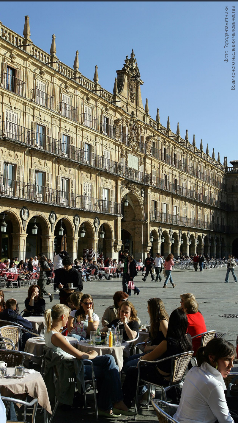
Фото: Города-памятники Всемирного наследия человечества