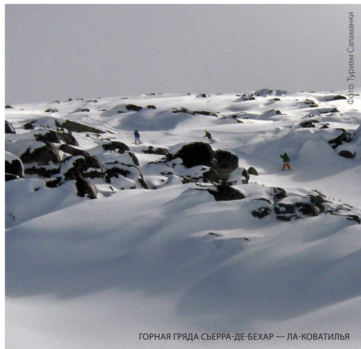
ГОРНАЯ ГРЯДА СЬЕРРА-ДЕ-БЕХАР — ЛА-КОВАТИЛЬЯ

плиты, придорожные столбы и сточные трубы. Если вы увлекаетесь лыжами, вам будет полезно узнать, что совсем недалеко отсюда находится горнолыжная станция гряды Сьерра-де-Бехар — Ла-Коватилья.