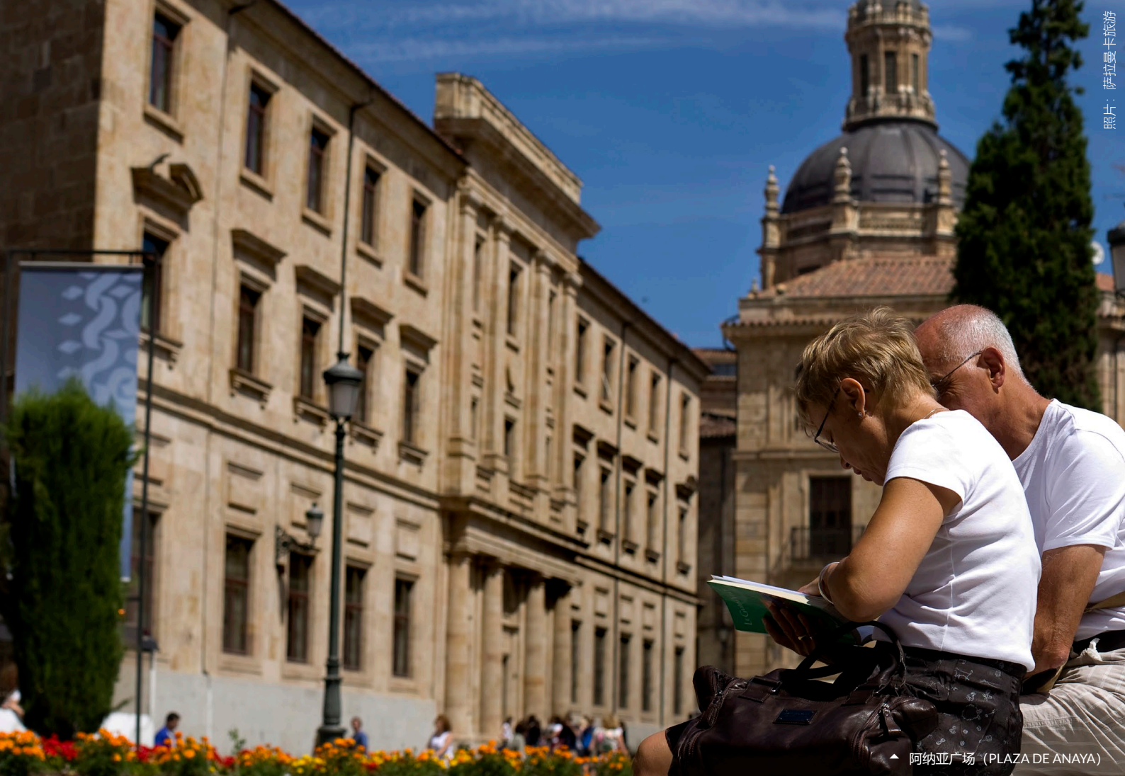
▲ 阿纳亚广场 (PLAZA DE ANAYA)