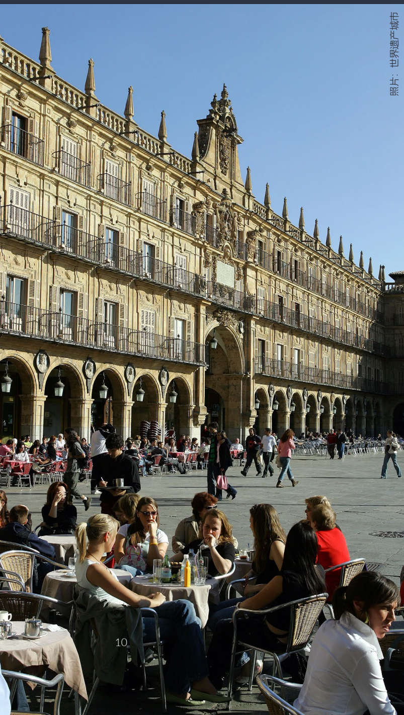
托莱多·西班牙·日照