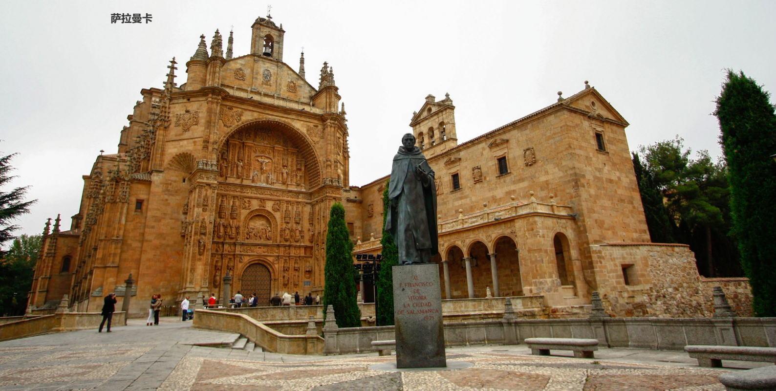
▲ 圣埃斯特万修道院

另一个例子是欧雷亚纳宫殿，它打破了银匠式建筑的传统。最原创的元素之一就是连接上下檐廊的阶梯，它位于塔楼后侧的墙面的一端。