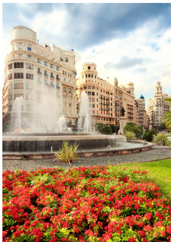
▲ ПЛОЩАДЬ ГОРОДСКОГО СОВЕТА

Если вы любитель народных ремесел, зайдите на рынок на площади Пласа-Редонда в районе La Xerea и купите несколько сувениров.