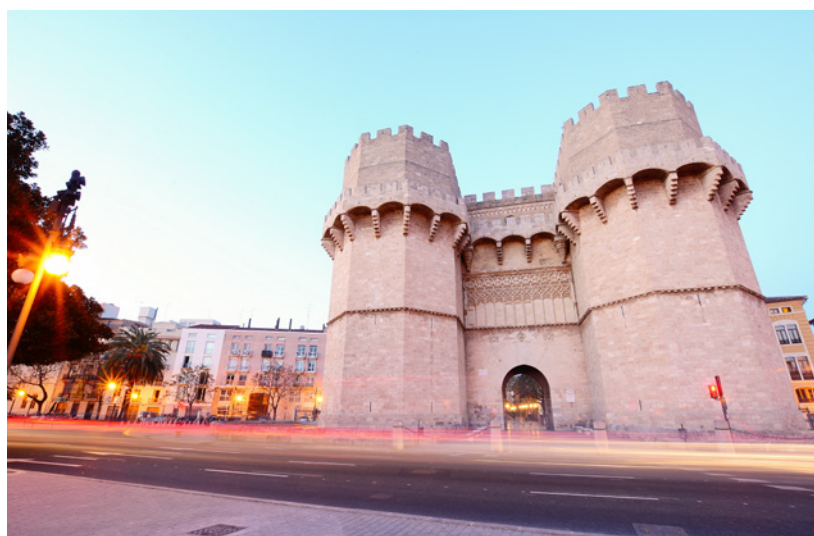
▲ БАШНИ СЕРРАНОС