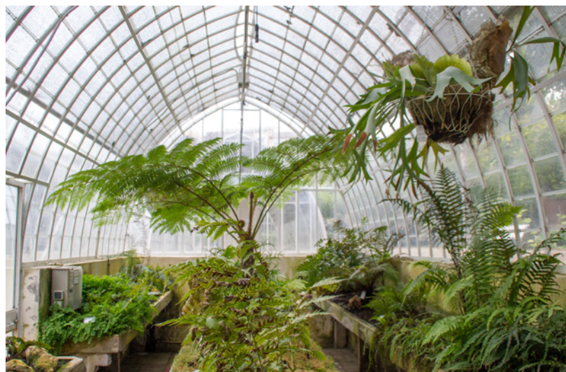
▲ БОТАНИЧЕСКИЙ САД