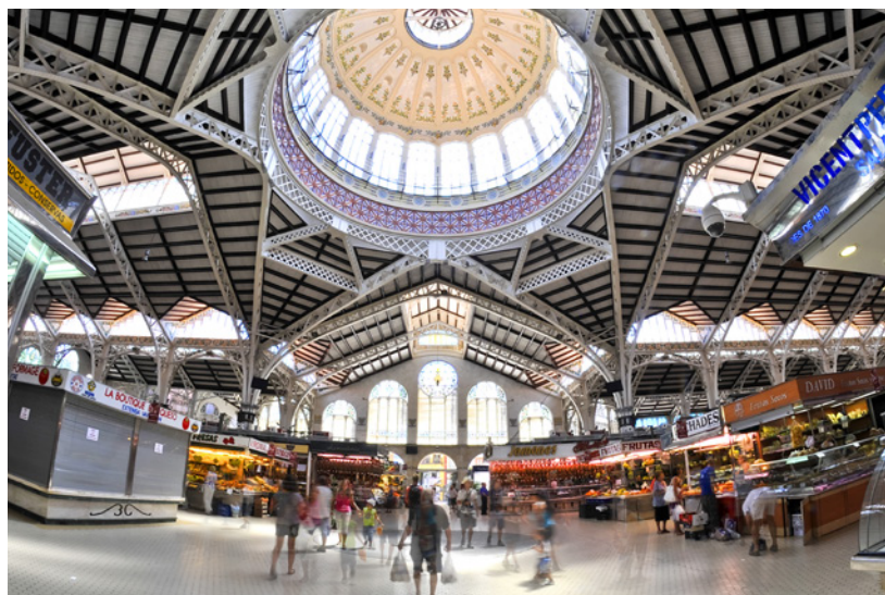
▲ ЦЕНТРАЛЬНЫЙ РЫНОК

Познакомьтесь с одной из жемчужин Валенсии — районом Эль-Кабаньяль . Вам понравится бродить среди его разноцветных, облицованных изразцами домов. Не забудьте побывать на рынке, где продают свежие продукты.