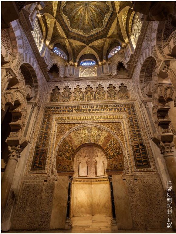
市城文化遗产 照片：世界遗产