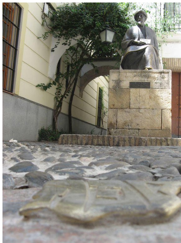
▲ 迈蒙尼德的雕像和广场

在同一条线路上，你也可以参观阿尔安达卢斯生活博物馆 (Museo Vivo de al-Ándalus)，博物馆位于卡拉奥拉塔内，有两个目标：了解安达卢斯的文明，并