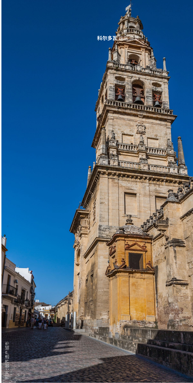
市城文化遗产

在同一个街区,你还可以参观犹太教堂,这是西班牙保存最完好的教堂之一。它建于14世纪初,到近几个世纪也作他用。由于保护工作做得好,这里保存的希伯来文铭文的数量和质量均属上乘。