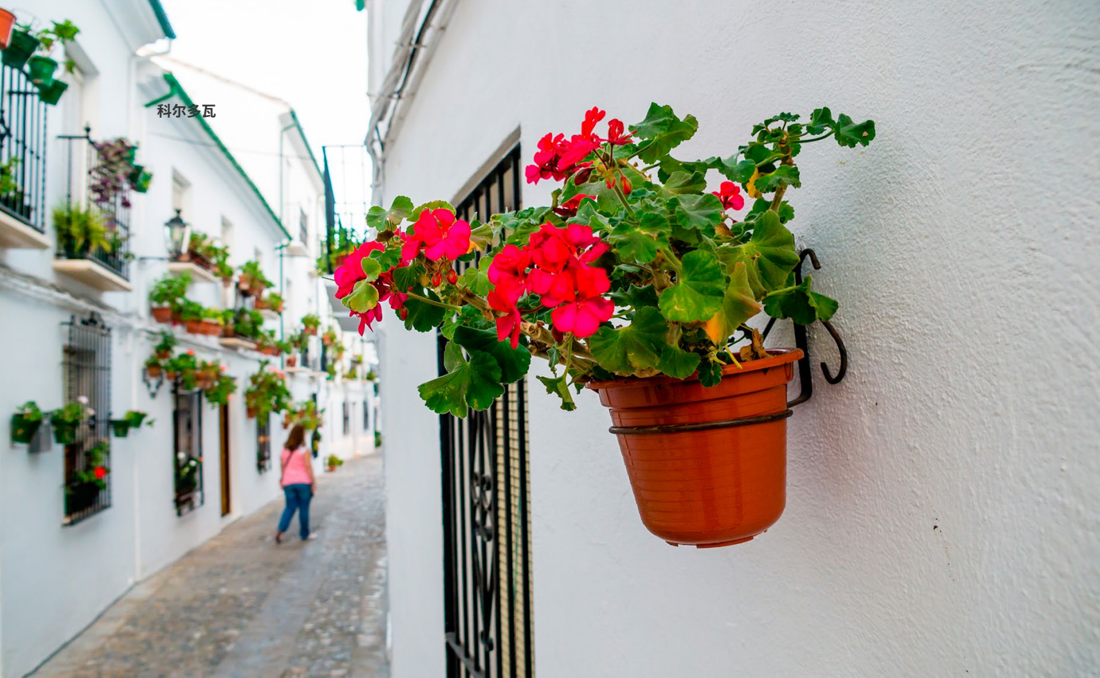
▲ 科尔多瓦的普列戈

如果你想了解该地区最古老的城镇之一，可以前往迷人的卡布拉(Cabra)。这里被山脉、泉水和美丽的自然景观环绕，两侧的围墙和美丽的卡布拉公爵城堡保留了安达卢西亚的历史痕迹。此外，这里还有安达卢西亚最有趣的巴洛克风格建筑群之一，包括圣母升天和天使教堂等瑰宝。