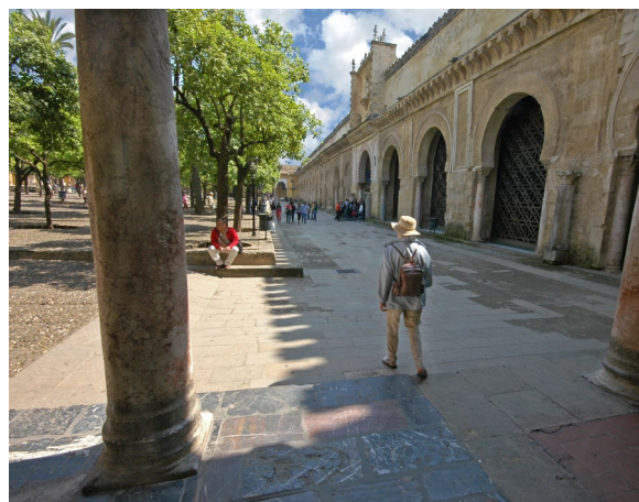
▲ 橘树庭院 科尔多瓦大清真寺

不出几米你就能找到科尔多瓦的灵魂和心脏——清真寺-大教堂，这里被列为人类遗产。可以通过救赎之门进入教堂。美丽的橘树庭院是清真寺内部带有无数双色马蹄形拱门的大殿的前厅。