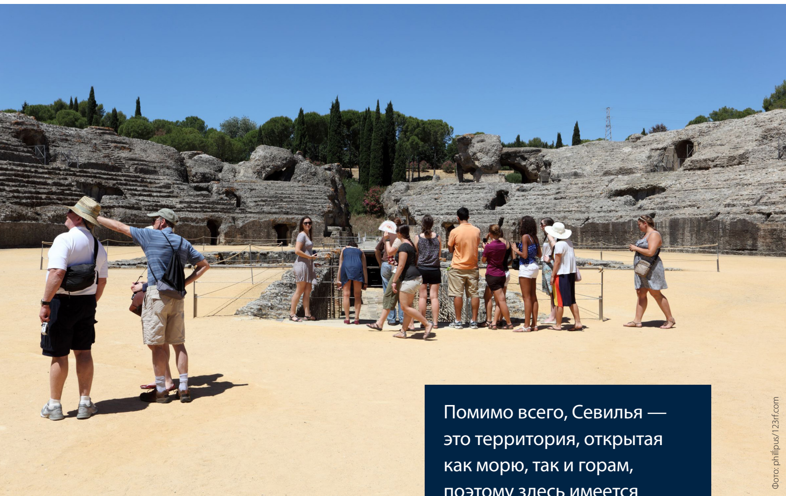
▲ АРХЕОЛОГИЧЕСКИЙ КОМПЛЕКС ИТАЛИКА САНТИПОНСЕ

Также знаменит город Марчена , который славится своим монументальным ансамблем, где особое место занимают церковь Святого Иоанна Крестителя и арка Арко-де-ла-Роса. Город также знаменит своей Страстной неделей и как одна из «колыбелей» андалузского фламенко.