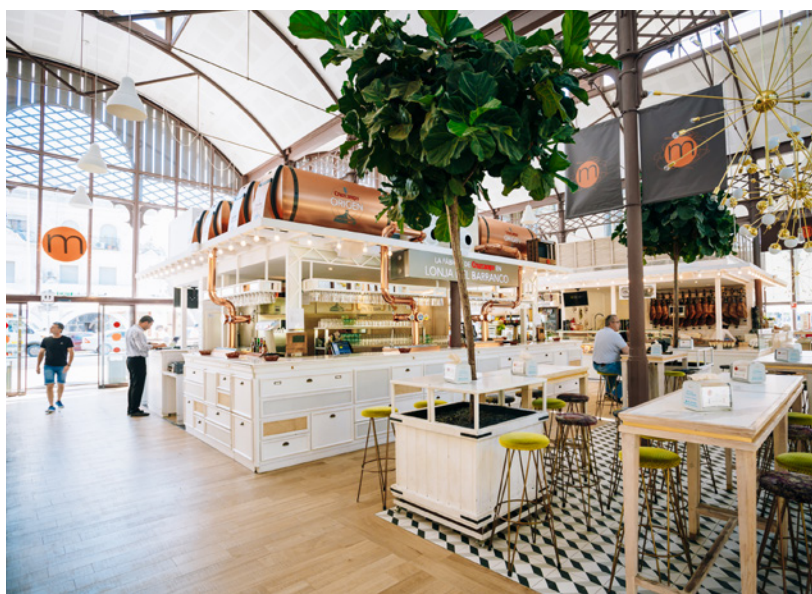
▲ РЫНОК-АУКЦИОН БАРРАНКО

Пересеките мост Трианы, и вы окажетесь на рынке Меркадо-дель-Ареналь . Здесь вы найдете от заведений с традиционными блюдами из андалузских и экологических продуктов до креатив-