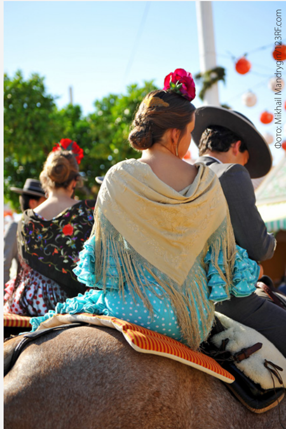
▲ АПРЕЛЬСКАЯ ЯРМАРКА СЕВИЛЬЯ

Также ждет встречи с вами Апрельская ярмарка . Это Ферия с большой буквы, начало которой знаменуют 250 000 загорающихся лампочек над ярмарочной площадью. Здесь танцуют, поют и