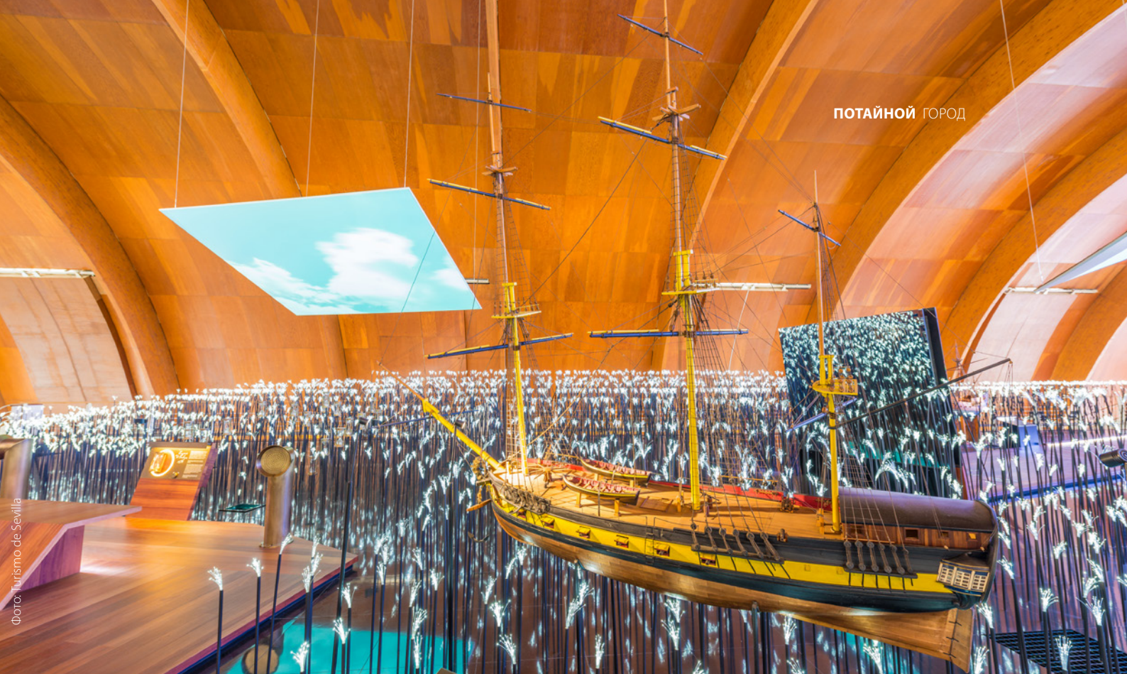
▲ ПАВИЛЬОН МОРЕПЛАВАНИЯ

Познакомьтесь с павильоном мореплавания на острове Картуха. Это место находится у берегов реки Гуадалькивир, недалеко от исторического центра, и представляет Севилью как порт, откуда было начато исследование и завоевание Америки.