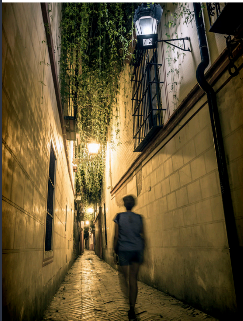
▲ КВАРТАЛ САНТА-КРУС

Дворец Мигель де Маньяра — это еще одно монументально строение, которое служило резиденцией аристократов с 1623 года. Церковь Санта-Мария да Бланка , выстроенная на месте старинной синагоги XIII века, сохраняет свою оригинальную структуру, хотя была реставрирована дважды: сначала в XIV веке, а затем в XVII веке, превратившись в один из лучших образцов севильской архитектуры барокко.