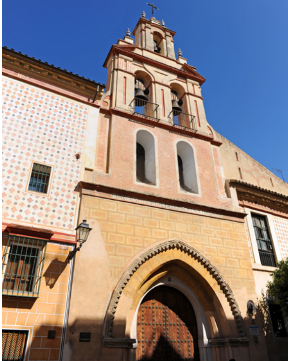
▲ ЦЕРКОВЬ САНТА-МАРИЯ ЛА БЛАНКА СЕВИЛЬЯ