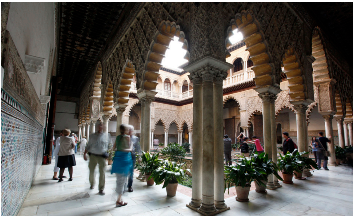
▲ КОРОЛЕВСКИЙ ДВОРЕЦ-КРЕПОСТЬ АЛЬКАСАР В СЕВИЛЬЕ

Севиля примечательна своими невероятно интересными кварталами. Такими, как район Санта-Крус , в самом центре, со своими улочками, дворцами и утопающими в цветах двориками; Триана , на другом берегу реки Гуадалquivир с морским шармом и искусством фламенко; и Ла-Макарена , наполненный традициями и историей.