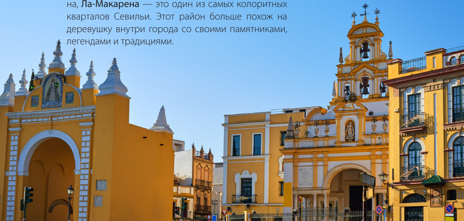
▲ АРКА И БАЗИЛИКА ЛА-МАКАРЕНА

Расположенный на севере исторического района, Ла-Макарена — это один из самых колоритных кварталов Севильи. Этот район больше похож на деревушку внутри города со своими памятниками, легендами и традициями.