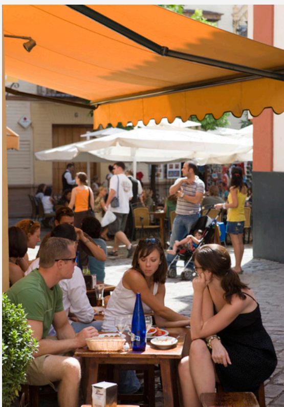
▲ КВАРТАЛ САНТА-КРУС

Не имеет значения, какую пору года вы выберете для того, чтобы посетить Севилью. Здесь вам всегда будет чем заняться: отправиться в поход по тапас-барам, побывать на представлении фламенко, поплавать по реке Гуадалькивир или испытать колдовское очарование Страстной недели.