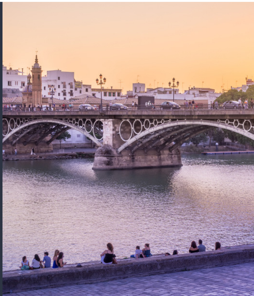
▲ МОСТ ИЗАБЕЛЛЫ II

В Триане вы также встретите такие шедевры архитектуры, как переулок Инквизиции , где все еще сохраняются остатки старинного замка святого Георгия. В базилке Патросинио (базилика Покровительства) вы сможете увидеть образ Эль Качорро («Детеныш») — это эмблематическая фигура Страстной недели в Севилье.